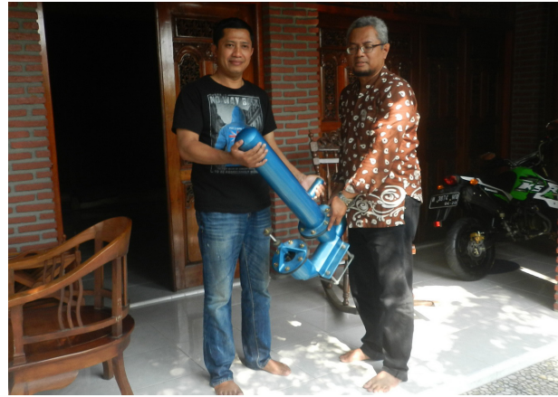
Gambar 5. Mitra Melihat Langsung Objek Pompa Hidram

Teknologi pompa hidram memiliki prinsip kerja yang sangat sederhana sehingga kegiatan transfer teknologi dari tim PKM dengan mitra dapat berlangsung dengan mudah.