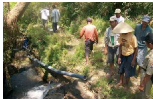
Gambar 10. Instalasi Pipa Pesat Dari Bendungan Ke Hidram, Mitra PKM Aktif Membantu