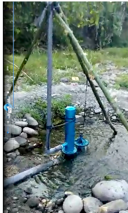
Gambar 11. Pompa hidram dan pipa naik ke lokasi lahan atas

Mitra PKM sangat antusias dan senang bekerja bakti membantu tim PKM membuat bangunan sipil