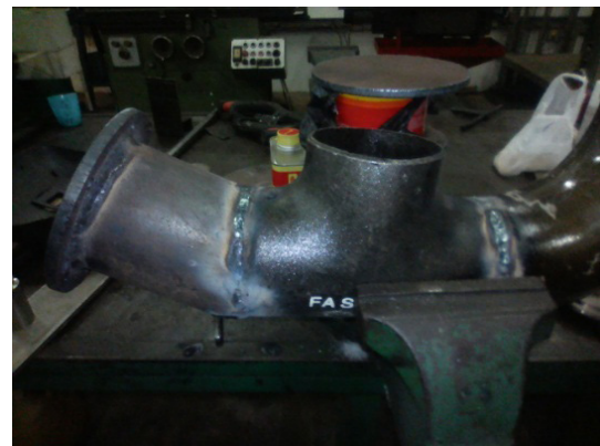
Gambar 6. Proses Pengerjaan Pompa Hidram