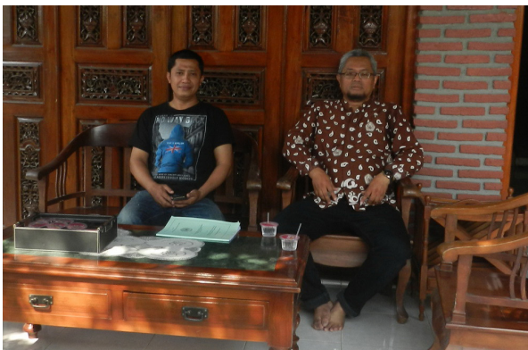
Gambar 4. Koordinasi Bersama Mitra PKM

Persiapan awal kegiatan pengabdian telah dilakukan tim PKM dengan mengunjungi beberapa pihak terkait yaitu Kepala kelurahan Sukorejo dan wakil mitra PKM. Hasil kunjungan ini yaitu penegasan kembali kerja sama dan tidak lanjut pelaksanaan kegiatan pengabdian di kelurahan Sukorejo.