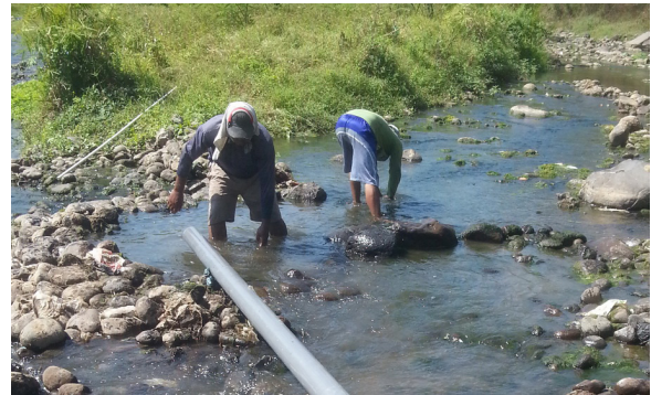
Gambar 9. Bendungan Sederhana Untuk Membuat Terjunan Air

air sehingga debitnya cukup stabil meski di musim kemarau. Terjunan air sekitar 2-3 meter dari sungai bawah kemudian dipompa dengan hidram naik ke lokasi perikanan atas sekitar 10 meter lebih tinggi.