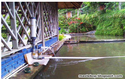
Gambar 1. Pompa hidram (Hidraulic Ram) sederhana

Pompa hidraulic ram (hidram) adalah teknologi yang memungkinkan kita memindahkan air dari tempat yang lebih rendah ke tempat yang lebih tinggi hanya dengan menggunakan energi air itu sendiri. Alat ini menggunakan tekanan dinamik dari air untuk mengkonversinya ke head (ketinggian) yang lebih tinggi dengan debit aliran yang lebih rendah dari sumber air asalnya. Hidram tidak membutuhkan sumber tenaga tambahan, ramah lingkungan, biaya operasi murah, tidak perlu pelumas dan hanya terdiri dari dua komponen bergerak.