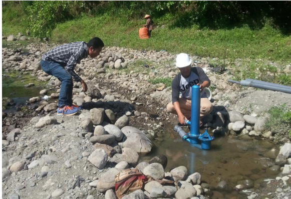
Gambar 7. Mencari Letak Posisi Pompa Bersama Mitra

melakukan survei ulang untuk mendapatkan tempat yang sesuai diperlihatkan pada gambar.