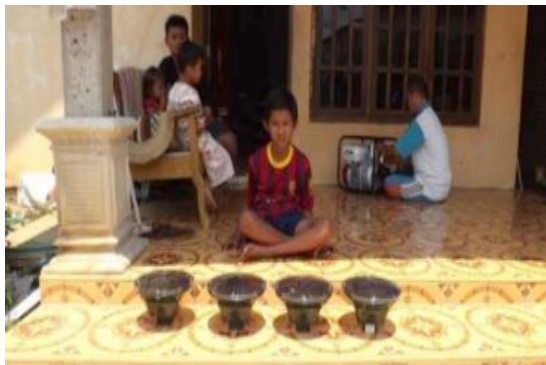
Gambar 13. Pengujian Pengisian Baterei dengan Sel Surya

Pembuatan dan pemasangan pengendali hama elektronik ini meliputi proses perencanaan, pengujian dan pelaksanaan yang terpadu sehingga bisa dihasilkan sistem yang benar-benar dimanfaatkan sesuai dengan harapan.