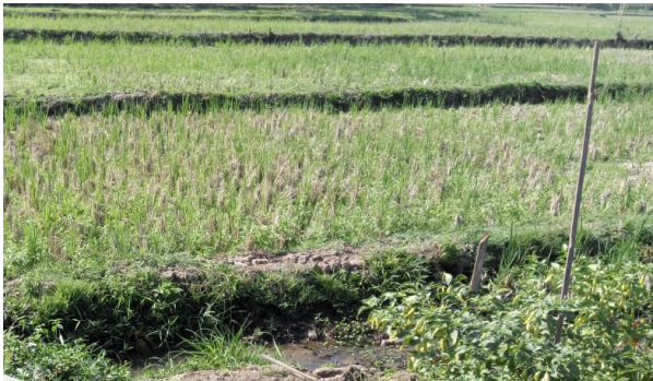
Gambar 12. Menentukan Titik Alat Pengendali Hama Elektronik

Letak pengendali hama elektronik perlu ditentukan agar efek pengendaliannya dapat merata pada lokasi lahan pertanian dan perkebunan.