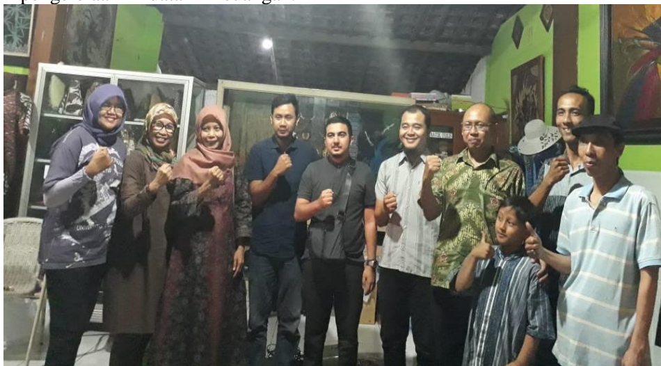
Gambar 1 Tim pengabdian bersama UKM mitra

Kegiatan pengabdian masyarakat ini diawali dengan pelatihan manajemen keuangan dengan menggunakan teknologi informasi. Sebelum dilaksanakan kegiatan pendampingan, sistem administrasi keuangan telah dilakukan dengan baik namun masih manual belum memanfaatkan teknologi informasi dengan komputer. Pelatihan yang dilakukan meliputi penggunaan fitur-fitur pada program microsoft excel untuk pencatatan dan penghitungan data keuangan UKM. Pengetahuan terhadap dasar-dasar pemrograman excel diperlukan karena pada rancangan sistem informasi manajemen batik yang akan dibuat pada tahapan berikutnya, hasil output yang diperoleh disimpan dalam data excel. Dokumentasi kegiatan pada tahap ini disajikan pada Gambar 1.