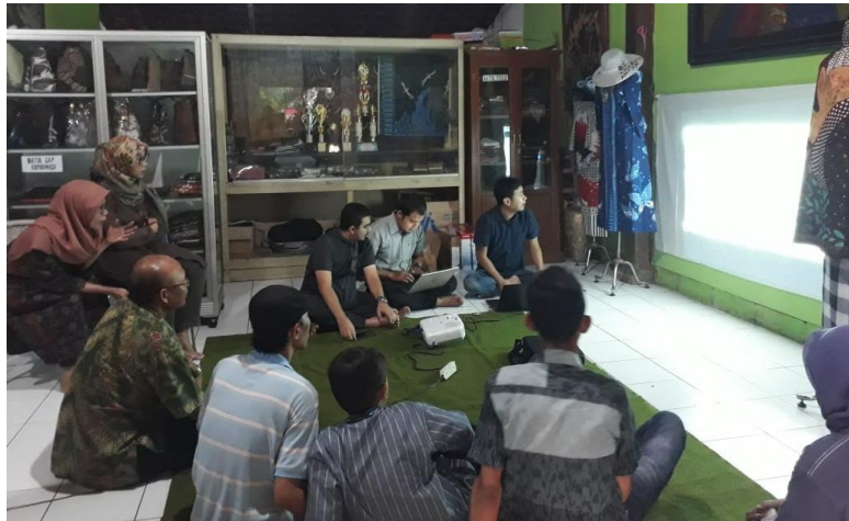
Gambar 4 Pelatihan penggunaan sistem informasi manajemen batik UKM Mutiara Hasta