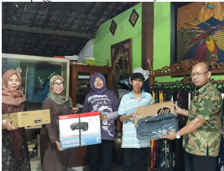
Gambar 5 Penyerahan seperangkat peralatan yang digunakan sebagai pendukung sistem informasi manajemen pada UKM Mutiara Hasta

Sistem informasi yang telah dikembangkan beserta seperangkat laptop, LCD dan printer untuk mencetak hasil laporan selanjutnya diserahkan kepada UKM mitra sebagai sumbangan dari tim pengabdian. Melalui kegiatan ini UKM Mutiara Hasta sebagai mitra pengabdian telah memiliki sistem informasi untuk perbaikan tatakelola administrasi dan keuangan UKM. Oleh karena itu hasil kegiatan pengabdian telah memberikan dampak yang positif bagi perkembangan UKM mitra.