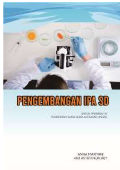
Gambar 2. Halaman Depan Buku

Adapun spesifikasi dari bahan ajar ini adalah mencakup :a) Materi, b)Rangkuman, c) Latihan soal, d) Kunci jawaban, d)Daftar Pustaka, dan e)Biografi Penulis