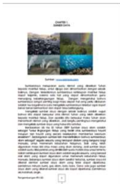
Gambar 3. Tampilan Isi Materi Bahan Ajar

Spesifikasi bahan ajar ini adalah berukuran A4/kwarto, isi 109 halaman, full color/berwarna, menggunakan jenis font Century Gothic size 12 spasi 1.