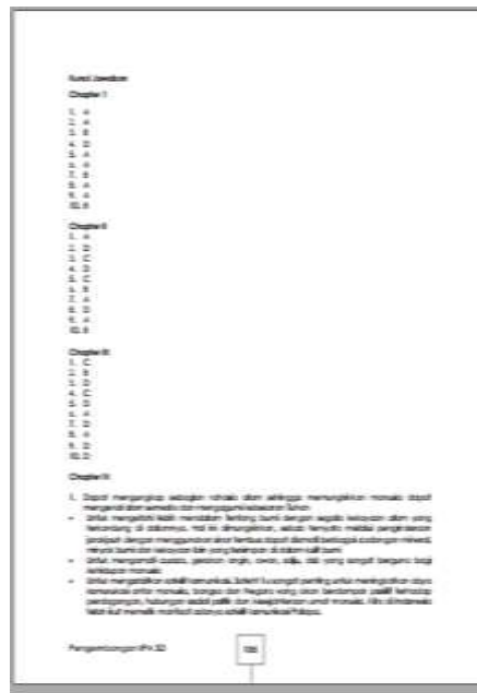
Gambar 5. Tampilan Kunci Jawaban pada Bahan Ajar

Bahan ajar ini didesain penuh dengan materi pengembangan IPA SD. Hal ini bertujuan untuk memperkaya pengetahuan tentang pengembangan IPA SD. Adapun materi dalam bahan ajar yang terdiri dari 8 chapter/bab ini adalah sebagai berikut :