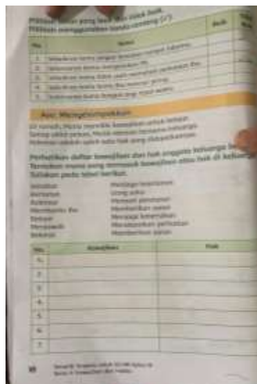
Gambar 3. Contoh Gambar Buku Tematik Kelas 3 Tema 4 hal.18

Dalam implementasi model pembelajaran Collaborative Teamwork Learning ini, diawali dengan guru membagi siswa dan siswi kedalam 6 kelompok dari jumlah siswa sebanyak 24 orang. Setelah itu guru menjelaskan materi mengenai hak dan kewajiban, dilanjut dengan guru memberikan penugasan yang harus dilakukan secara berkelompok. Tugas tersebut yaitu mengisi tabel yang rumpang dan diisi dengan pilihan mana yang termasuk hak ataupun kewajiban.