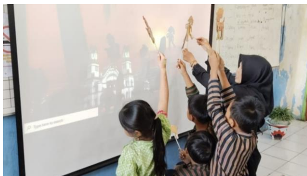
Gambar 3. Penerapan wayang tanah liat Warak Ngendog

Berdasarkan tabel 1 perbandingan hasil belajar di atas bahwa pada siklus kedua peserta didik yang tuntas yaitu 20 anak atau 71%. Sedangkan yang tidak tuntas yaitu 8 anak atau 29%. Rata-rata pada 28 siswa sebesar 78,21 dengan nilai paling rendah 60 dan nilai paling tinggi sebesar 100. Oleh karena itu pada pembelajaran siklus II belum memenuhi indikator keberhasilan maka diperlukan adanya pertemuan berikutnya pada siklus III.