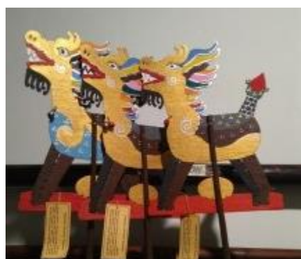
Gambar 2. Pembuatan Wayang Tanah Liat Warak Ngendog