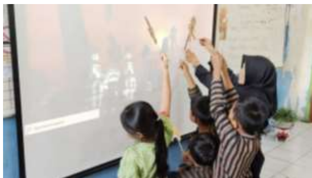
Gambar 3. Penerapan wayang tanah liat Warak Ngendog

Berdasarkan tabel tabel 1 perbandingan hasil belajar di atas bahwa pada siklus kedua peserta didik yang tuntas yaitu 20 anak atau 71%. Sedangkan yang tidak tuntas yaitu 8 anak atau 29%. Rata-rata pada 28 siswa sebesar 78,21 dengan nilai paling rendah 60 dan nilai paling tinggi sebesar 100. Oleh karena itu pada pembelajaran siklus II belum memenuhi indikator keberhasilan maka diperlukan adanya pertemuan berikutnya pada siklus III.