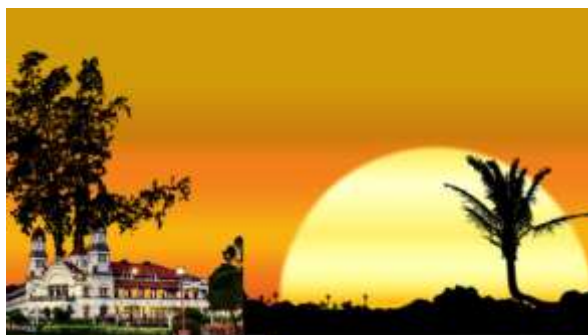
Gambar 1. Desain Latar Pagelaran Wayang Warak Ngendog

Pentingnya dalam mengetahui konsep pada keterampilan elemen berbicara secara konsisten dapat memberikan pengaruh yang besar pada hasil belajar dan kreativitas yang bermakna pada peserta didik. Berdasarkan hasil belajar pada siswa kelas 2A SDN Sronдол Wetan Semarang pada materi mendongeng yang dilakukan masih tergolong rendah. Adapun kegiatan pelaksanaan pertama adalah pada Selasa, 23 April 2024, yakni dengan menyusun perangkat pembelajaran secara lengkap dengan desain awal adalah pembuatan media yang akan digunakan dalam proses pembelajaran yaitu desain panggung pagelaran dongeng dan pembuatan wayang tanah liat warak ngendog.