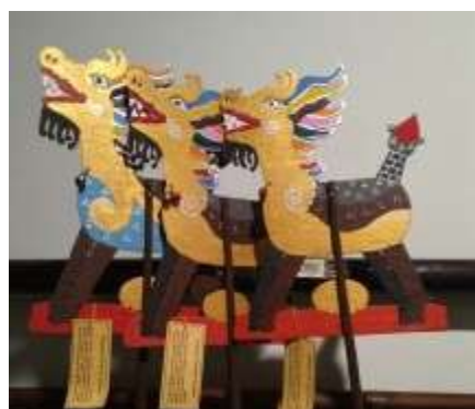
Gambar 2. Pembuatan Wayang Tanah Liat Warak Ngendog