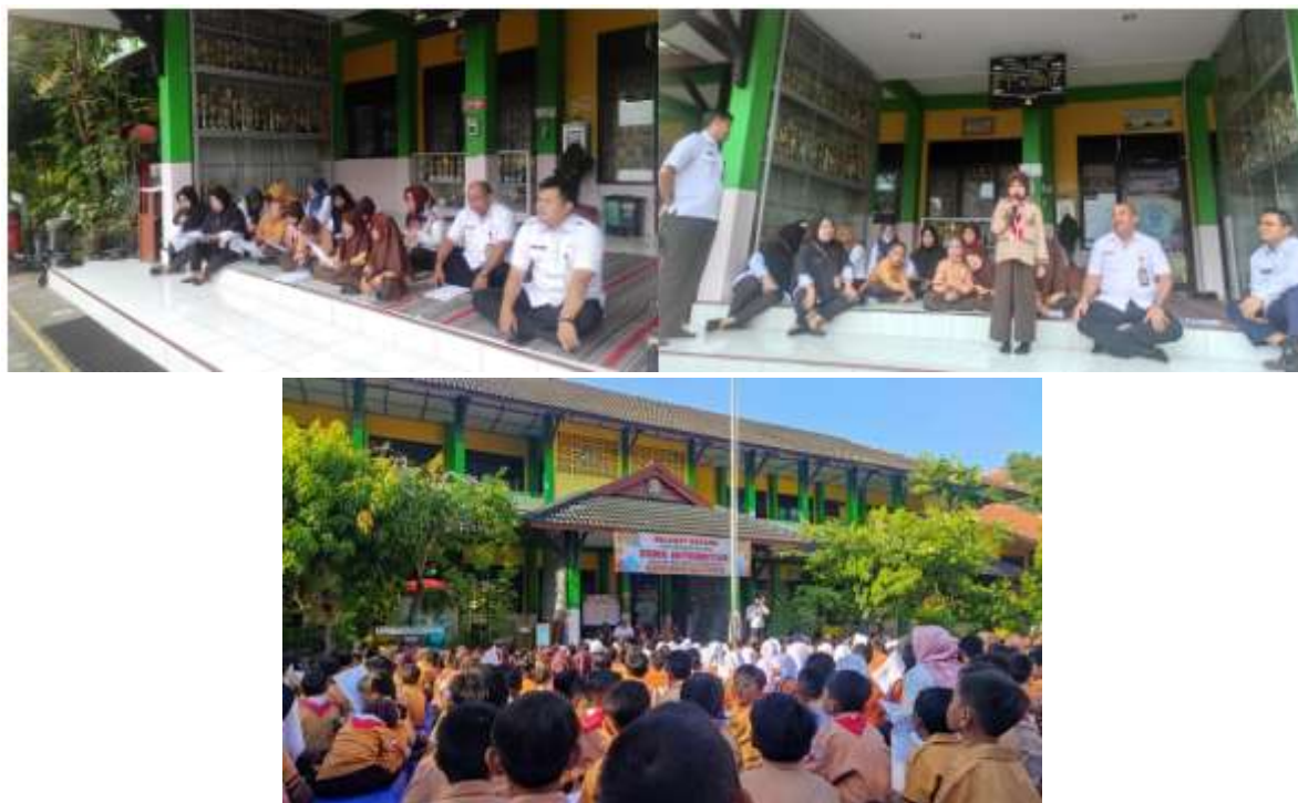
Gambar 2. Pembiasaan Membaca Asmaul Husna

Pembiasaan membaca asmaul husna di SDN Wonotingal yang melakukan kegiatan setiap hari rabu dengan mengharapkan bahwa peserta didik mampu menerapkan makna dari asmaul husna dan memanfaatkan serta keberkahan yang akan diperoleh karena sudah mengamalkan asmaul husna. Manfaat dan keberkahan yang diperoleh jika mengamalkannya yakni dibukakan pintu rezeki yang halal dengan mudah serta berlimpah, menghindari dari penyakit hati (iri, dengki dan segala penyakit negatif lainnya), menyembuhkan penyakit fisik maupun psikis. Dari program pembiasaan membaca asmaul husna ini dapat menjadikan peserta didik yang berkarakter lebih baik lagi, baik terhadap diri sendiri maupun menjadi keunggulan bagi sekolah.. Faktor yang mempengaruhi pembentukan karakter antara lain: