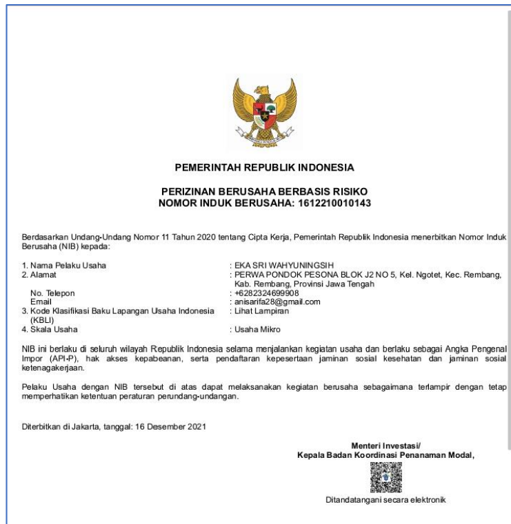
Gambar 4. NIB UMKM Sambel pecel Bu Heru

Dalam pengurusan NIB Tim KKU meminta kelengkapan isi dokumen dari UMKM Sambel Pecel Bu Heru berupa nama & NIK, alamat tinggal, bidang usaha, lokasi usaha, besarnya modal usaha, nomor kontak usaha serta NPWP. Pengurusan OSS relatif mudah karena dilakukan secara online . Hasil kegiatan ini adalah terbitnya NIB UMKM Sambel pecel Bu Heru dengan nomor 1612210010143.