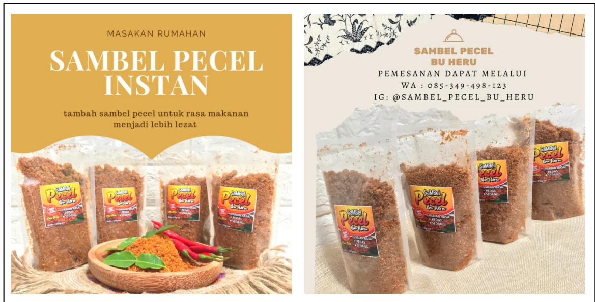
Gambar 1. Katalog Foto UMKM Sambel Pecel Bu Heru

Pengambilan foto dilakukan pada tanggal 28 Oktober 2022. Setelah pengambilan foto, kemudian diedit. Berikut adalah hasil dari pembuatan foto katalog produk Sambel Pecel Bu Heru.