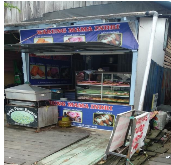
Gambar 1. Tampilan tempat usaha Kedai Mama Indri di Pasar Kemuning Kelurahan Loa Bakung

penyusunan matriks EFAS, menentukan diagram SWOT dan matriks SWOT.